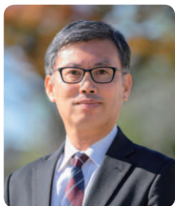
茨城大会実行委員会 委員長

学校教育の質の向上や働き方改革など、学校は大きな転換期にある中「日本社会に根差したウェルビーイングの向上」に向けて中心となるのが私たち副校長・教頭です。この研究大会は、各教頭会・副校長会が、政策提言能力を備えた職能研修団体として力をつける、唯一無二の貴重な場です。全国の副校長・教頭先生が活発に意見を交わし、大いにその力量を磨いてほしいと願っています。全国の会員の皆様の積極的な参加をお待ちしております。