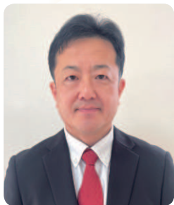
全国公立学校教頭会 会長